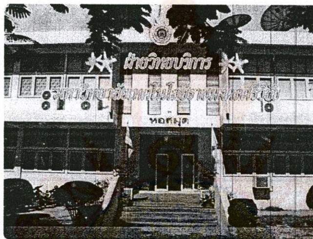
รูปที่ 2.2 ฝ่ายวิทยบริการ มหาวิทยาลัยเทคโนโลยีราชมงคลศรีวิชัย

พ.ศ.2551 เปลี่ยนแปลงโครงสร้างการบริหารงานโดยรวมกันกับงานเทคโนโลยีสารสนเทศ และงานผลิตสื่อและตำราเรียน แล้วเปลี่ยนเป็นงานฝ่ายวิทยบริการ มาจนถึงปัจจุบัน