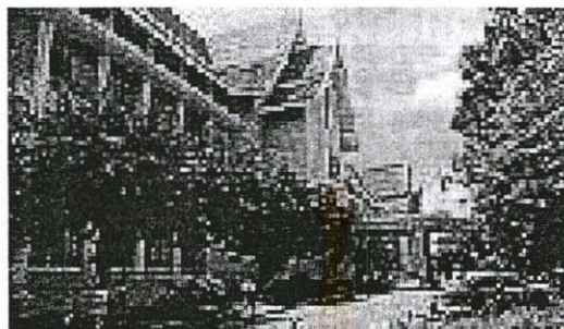
รูปที่ 2.1 หอสมุดแห่งชาติ ท่าวาสุกรี