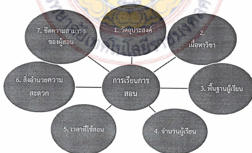
ภาพที่ 2.2 แสดงปัจจัยที่เกี่ยวข้องกับการจัดการเรียนการสอน

7. จิตความสามารถของครูผู้สอน ความสามารถหรือสมรรถภาพของครูผู้สอนครูผู้สอนจะต้องศึกษาทำความเข้าใจ สร้างประสบการณ์เกี่ยวกับวิธีการสอนรูปแบบต่าง ๆ เพื่อเพิ่มขีดความสามารถให้ดียิ่งขึ้น