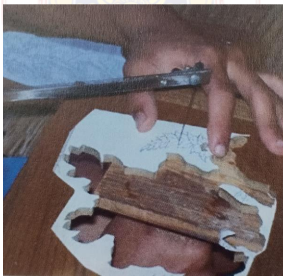
ขั้นตอนที่ 2