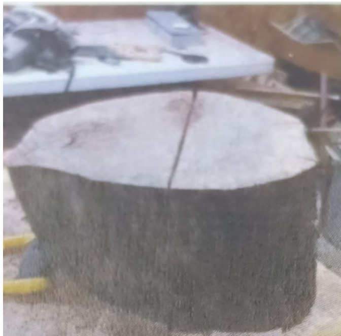
ส่วนของไม้เทพทาโร