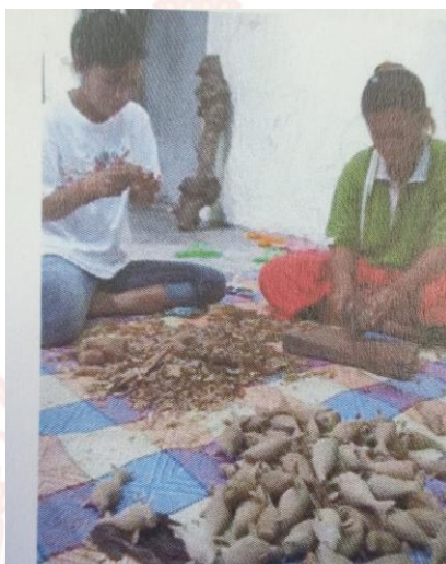
ขั้นตอนที่ 4