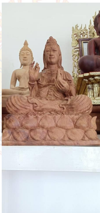
พระพุทธรูป