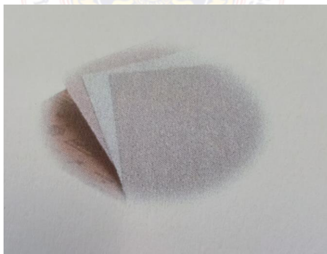
กระดามทราย