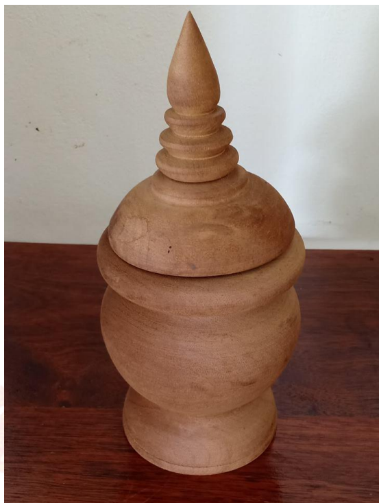
คนโทใส่น้ำ