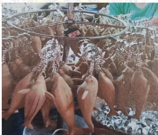
ขั้นตอนที่ 5