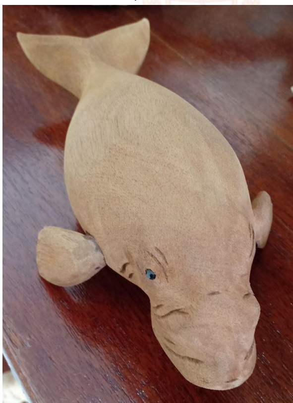
ปลาพะยูน