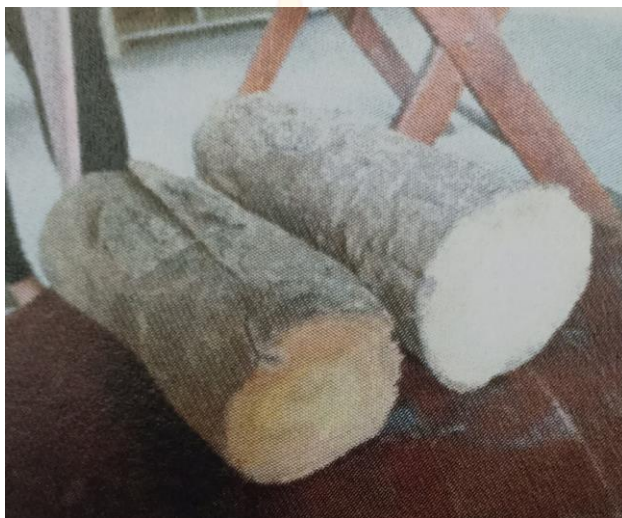
ขั้นตอนที่ 1