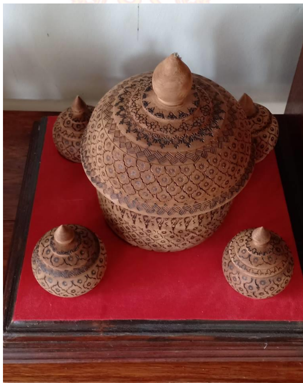
ชุดเบญจรงค์