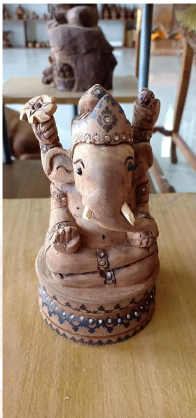
พระพิฆเนศ