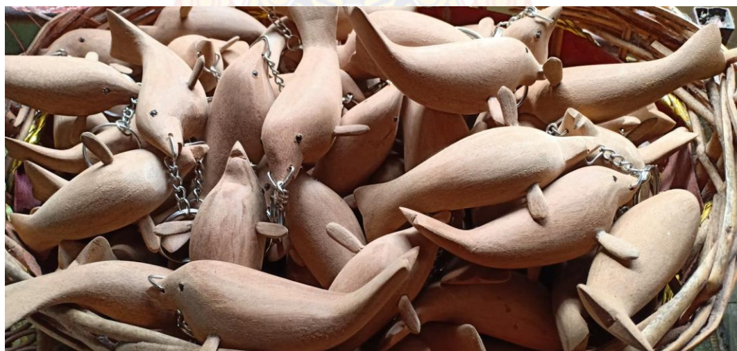
พวงกุญแจปลาพะยูน