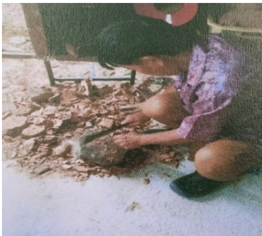
ขั้นตอนที่ 3