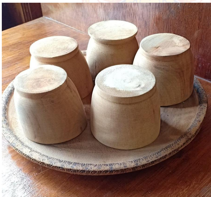
ชุดแก้วน้ำ