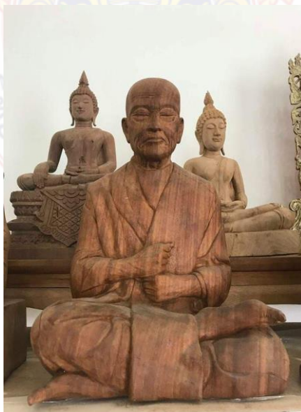
หลวงปู่ทวด