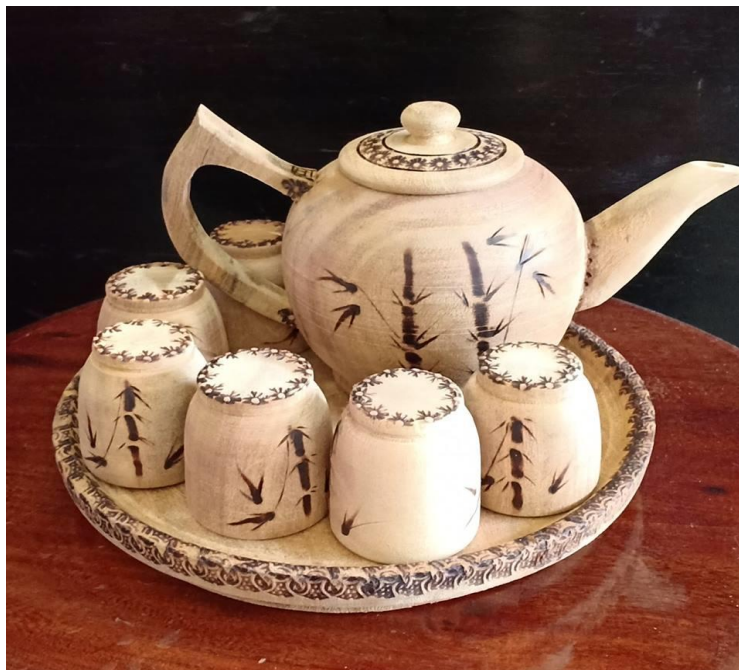
ชุดกาน้ำชา