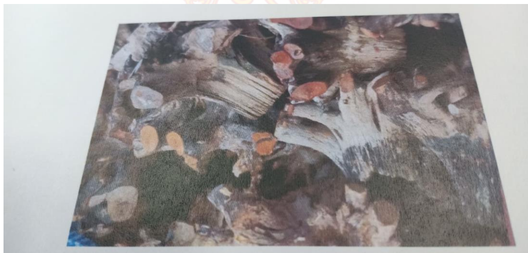
ส่วนของรากไม้