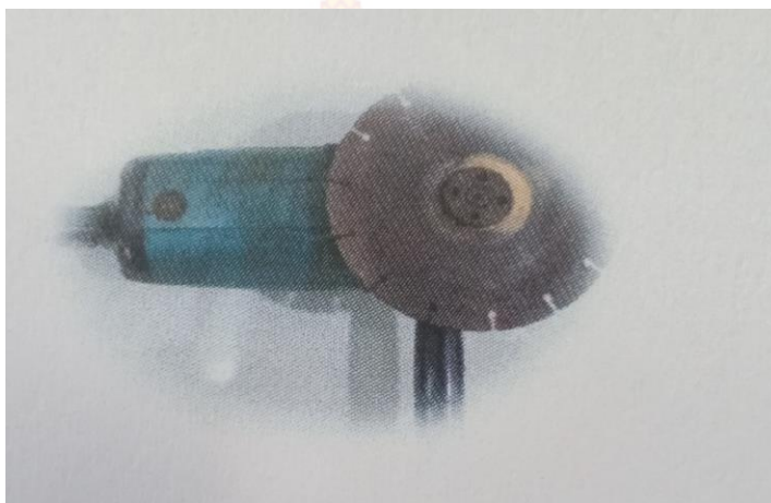
หินเจียร