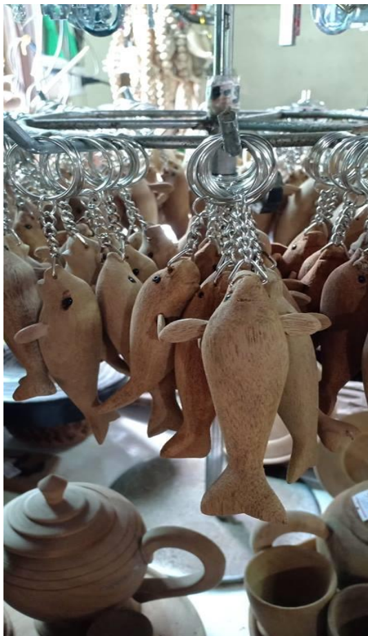
พวงกุญแจปลาพะยูน