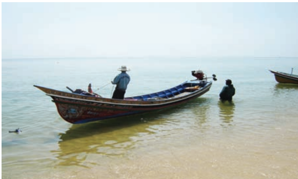
รูปที่ 2 อาชีพหลักทำการประมง หมู่บ้านดาโต๊ะ ต.แหลมโพธิ์ อ.ยะหริ่ง จ.ปัตตานี

4. ควรส่งเสริมให้สตรีได้รับรู้ข่าวสาร เพื่อเสริมบทบาทสตรีประมงพื้นบ้านในการมีส่วนร่วมในการจัดการการประมงโดยชุมชน ควรผ่านช่องทางทั้งที่เป็นสื่อสาธารณะ เช่น การประชุม และสื่อที่เป็นตัวบุคคลเช่นระหว่างสามี การสื่อสารภายในเครือข่ายหรือกลุ่มตระกูลเดียวกัน เพื่อขยายแนวร่วมออกไปในชุมชน โดยที่สตรีประมงพื้นบ้านมีความเข้าใจอย่างเพียงพอ เกิดการยอมรับและมีความต้องการในอนาคตให้เกิดระบบการจัดการ