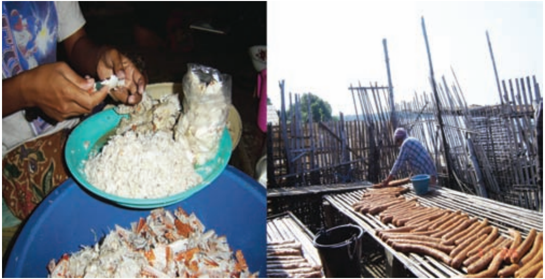
รูปที่ 3 อาชีพเสริมของสตรีประมงพื้นบ้าน คือ แกะเนื้อปูขาย (ซ้าย) และทำข้าวเกรียบ (ขวา) หมู่บ้านคาใต้ ต. แหลมโพธิ์ อ. ยะหริ่ง จ.ปัตตานี ที่มา: อัสনী (2550)

ประมงโดยชุมชนแล้ว จะทำให้คนอื่น ๆ เกิดความคล้อยตามด้วย ทำให้เกิดความมั่นใจที่จะสามารถแสดงความคิดเห็นร่วมกันในระบบการจัดการประมงโดยชุมชนอย่างมีประสิทธิภาพ