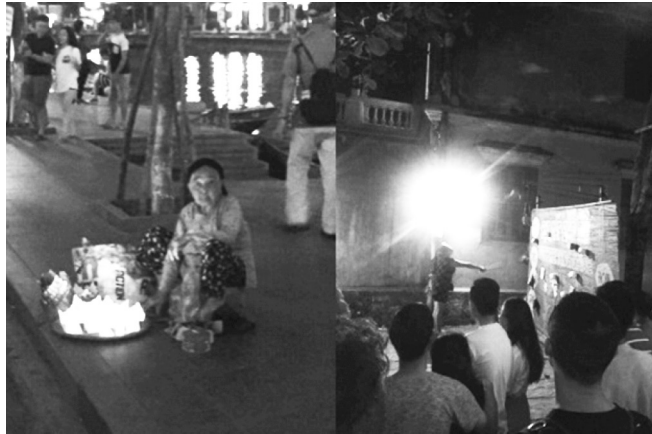
ภาพที่ 4 กิจกรรมส่งเสริมและสนับสนุนการท่องเที่ยวเมืองฮอยอันช่วงกลางคืน การลอยกระทง และการละเล่นในเขตเมืองโบราณ

สำหรับอีกหนึ่งกิจกรรมที่พบ คือ กิจกรรมนั่งรถสามล้อ (ซีโคล่า: Cyclo) เพื่อชมเมืองโบราณฮอยอัน โดยกลุ่มคนในฮอยอันรวมกลุ่มกันเพื่อนำมาให้บริการตามจุดต่างๆ ของเมือง ส่วนใหญ่เป็นการให้บริการนักท่องเที่ยวในช่วงเช้า และตอนเย็น