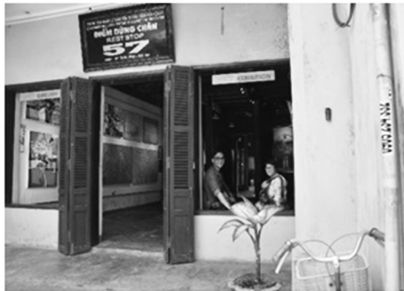
ภาพที่ 8 ป้ายแสดงเขตเมืองโบราณฮอยอันซึ่งห้ามนำรถยนต์และมอเตอร์ไซค์วิ่งผ่าน และ Rest stop สำหรับนักท่องเที่ยว ซึ่งเป็นพื้นที่จัดแสดงศิลปะภาพวาด ที่นั่งพัก และห้องน้ำ