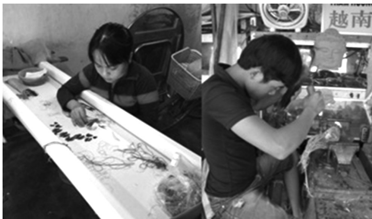
ภาพที่ 2 การทำงานปักผ้าและการแกะสลักของชาวฮอยอัน

งานปักไหม ทั้งนี้งานประเภทแกะสลักไม้ไฟและงานปักฝ้านั้นมีการผลิตในชุมชนซึ่งนักท่องเที่ยวสามารถเห็นขั้นตอนการผลิตได้