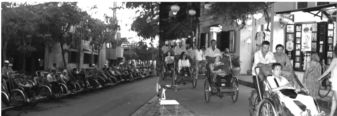
ภาพที่ 5 กิจกรรมนั่งรถสามล้อรอบเมืองฮอยอัน

ฮอยอัน มีการจัดพิพิธภัณฑ์ในตัวอาคารบ้านเรือนหลายแห่ง เช่น พิพิธภัณฑ์ Culture in Hoi An ซึ่งแสดงประวัติและหลักฐานทางวัฒนธรรมการผลิตสิ่งของเครื่องใช้ในชีวิตประจำวันของชาวฮอยอันในอดีต และ พิพิธภัณฑ์ The Museum of Folklore ซึ่งแสดงให้เห็นถึงลักษณะของบ้านและสิ่งของเครื่องใช้ของคหบดีชาวจีนในสมัยก่อน