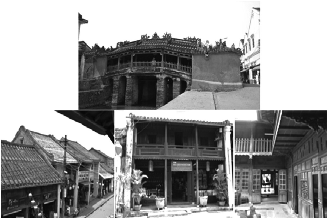
ภาพที่ 1 สะพานญี่ปุ่น และอาคารบ้านเรือนแบบฮอยอัน

2) ด้านศิลปหัตถกรรม พบว่า ในเมืองฮอยอัน มีงานศิลปกรรมหลากหลายประเภทเพื่อจำหน่าย เป็นสินค้า และสินค้าที่ระลึกแก่นักท่องเที่ยว ได้แก่ งานศิลปะภาพวาด งานแกะสลักไม้ไฟ และ