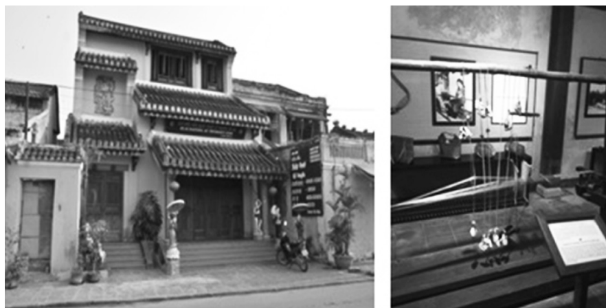
ภาพที่ 6 พิพิธภัณฑน์ในเมืองสอยอัน