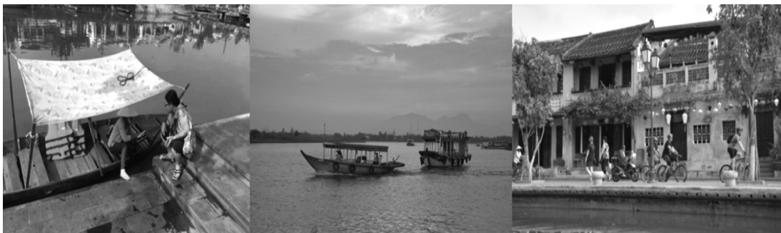
ภาพที่ 3 ริมแม่น้ำทูบอนช่วงเช้าและเย็น จะมีบริการนำเรือล่องลำน้ำทูบอนท่องเที่ยวโดยชาวเมืองฮอยอัน นักท่องเที่ยวต้องต่อรองราคาค่าเรือนำเที่ยวเอง นักท่องเที่ยวส่วนหนึ่งปั่นจักรยานเที่ยวริมแม่น้ำทูบอน และวิ่งออกกำลังกายตอนเช้าไปถึงตลาดเช้าเมืองฮอยอัน

นอกจากนี้ ยังมีการขายกระทงเพื่อให้นักท่องเที่ยวนำไปลอยใน ลำน้ำทูบอนในเวลากลางคืน โดยจะมีชาวเมืองฮอยอันนำกระทงมาขายให้กับนักท่องเที่ยวในราคา 20,000 คอง และการให้เช่าจักรยานเพื่อขี่ชมเมืองฮอยอัน สำหรับกิจกรรมที่ไม่ได้เก็บเงินจากนักท่องเที่ยว ได้แก่ การแสดงพื้นเมืองในเวลากลางคืน และการจัดกิจกรรมเล่นเกมพื้นบ้านคือ การปิดตาตีกระเบื้องในเวลากลางคืน และกิจกรรมการตกแต่งโคมไฟในทางเดินเมืองโบราณ เกิดจากความร่วมมือระหว่างเจ้าของร้านต่างๆ ที่อยู่ร่วมกัน เพื่อสร้างจุดเด่นให้กับนักท่องเที่ยว จากการสัมภาษณ์ตัวแทนผู้ประกอบการค้าขาย พบว่า เป็นความร่วมมือระหว่างคนในชุมชน ระหว่างผู้ประกอบการร้านค้า รวมถึงหน่วยงานท้องถิ่น