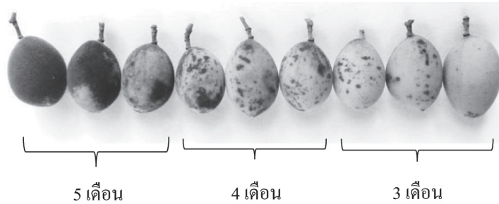
ภาพที่ 2 การเปลี่ยนแปลงลักษณะปรากฏของผลลูกหิระหว่างการพัฒนาของผล ตั้งแต่ระยะเริ่มแก่เขียว (3 เดือน หลังดอกบาน) จนถึงสุกเต็มแก่ที่สามารถเก็บเกี่ยวได้ (5 เดือนหลังดอกบาน)