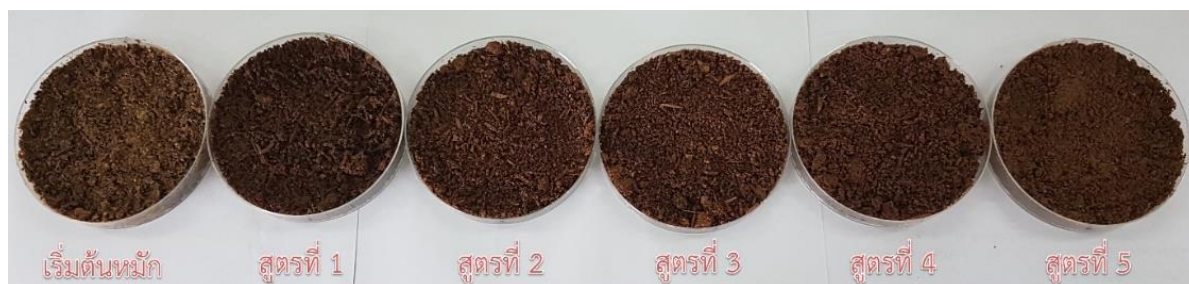
ภาพที่ 3 สีของปุ๋ยอินทรีย์สูตรต่าง ๆ หลังการหมักเป็นระยะเวลา 49 วัน

หมายเหตุ: สูตรที่ 1 (50:50) สูตรที่ 2 (60:40) สูตรที่ 3 (70:30) สูตรที่ 4 (80:20) สูตรที่ 5 (90:10)