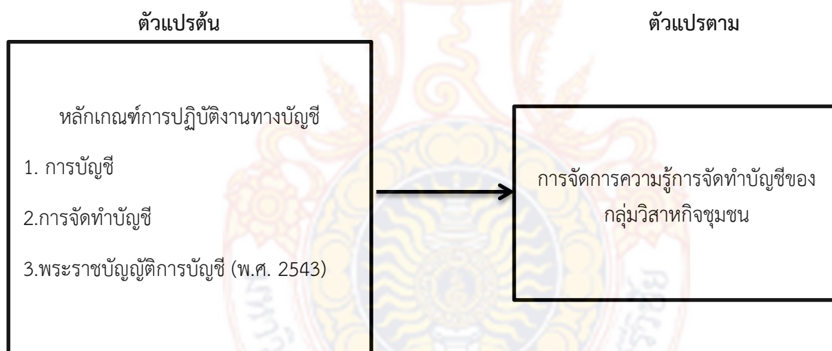
ภาพที่ 1 กรอบแนวคิดในการวิจัย