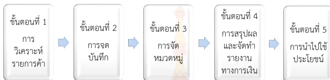
ภาพที่ 3 กระบวนการทางบัญชี

จากความหมายของการบัญชีข้างต้นจะเห็นได้ว่าการบัญชีเป็นกระบวนการตั้งแต่การบันทึกข้อมูล การประมวลผลข้อมูล และการจัดทำรายงานทางการเงิน ทั้งนี้เพื่อให้เข้าใจกิจกรรมทางการบัญชีในแต่ละขั้นตอนมากขึ้นจึงขอแบ่งกิจกรรมทางการบัญชีออกเป็น 5 ขั้นตอน ดังภาพที่ 3