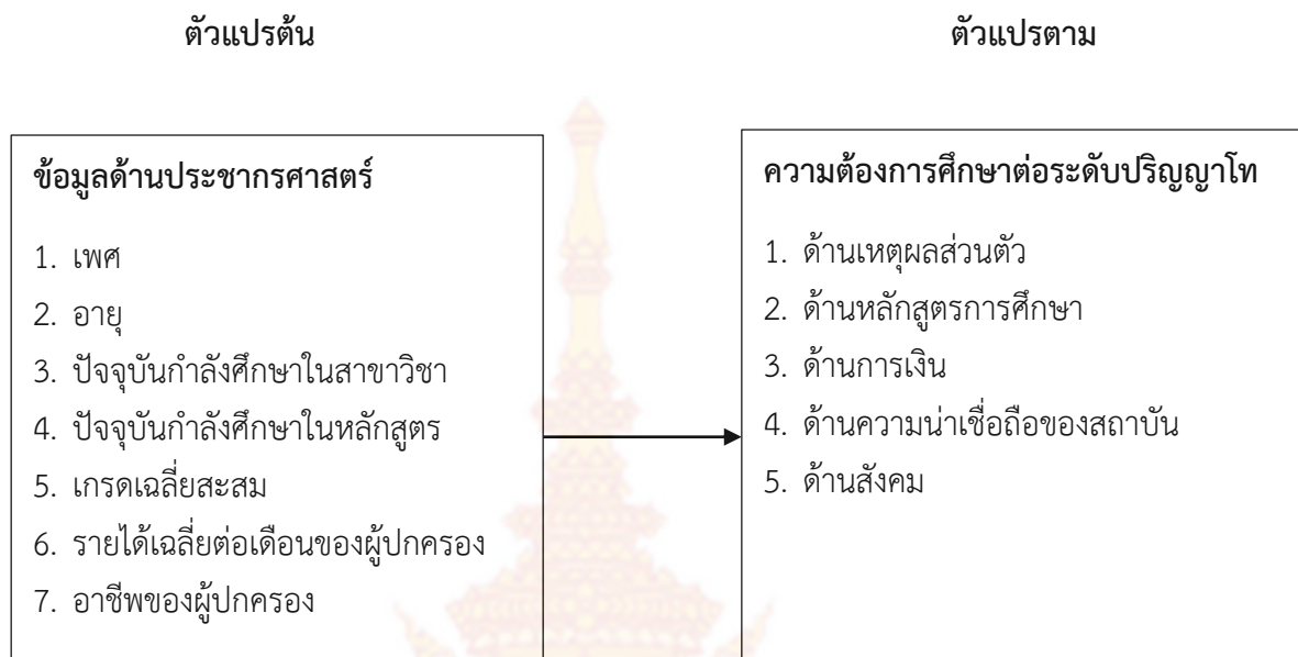
ภาพที่ 1-1 กรอบแนวคิดในการวิจัย