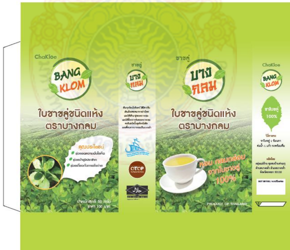
ภาพที่ 2.1 บรรจุกฎสำเร็จรูป