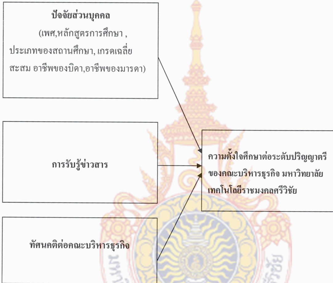
แผนภาพ 1 กรอบแนวความคิดในการวิจัย