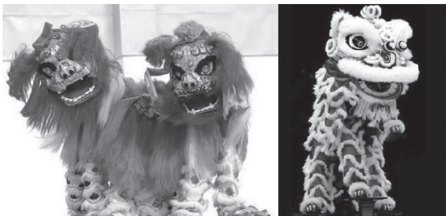
ภาพที่ 2 การเชิดสิงโตเหนือ (ภาพซ้าย) และการเชิดสิงโตใต้ (ภาพขวา)